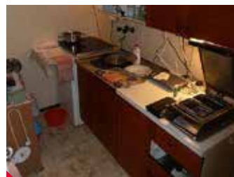
Padesát balených jídel vyráběl majitel v Ústí nad Labem v tomto kuchyňském koutě.

lených hotových jídel – Vladimír Piskáček v Ústí nad Labem. Ta fungovala přes internet na webu www.dobre-jidlo-na-rozvoz.cz . „Kontrolovaná osoba vyráběla balená právě hotová jídla – obědové menu cca 50 kusů denně – v kuchyňském koutě neodděleném od soukromých obytných prostor v bytě 1+1, a to za všeobecně nepřijatelných provozních podmínek,“ uvedl Kopřiva. ▶ zu