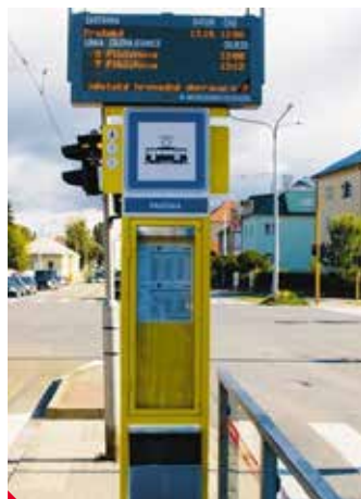
Takto vypadají inteligentní zastávky v Olomouci.

ÚSTÍ NAD LABEM – Městská hromadná doprava v Ústí nad Labem se v brzké době dočká dalšího pokroku. V místech, kde přestupuje nejvíce cestujících, by v budoucnu měly vyrůst inteligentní zastávky. Dosavadní plechové označníky s papírovými jízdními řády nahradí elektronická zařízení, kde cestující najdou nejen jízdní řády, ale také zjistí, za kolik minut skutečně přijede jejich spoj. Zařízení bude elektronicky spojeno jak s dopravním dispečinkem, tak s vozy MHD. Moderní zastávky budou pořízeny s pomocí evropských dotací. Rada města už schválila vyhlášení výběrového řízení na tyto zastávky. ▶ w