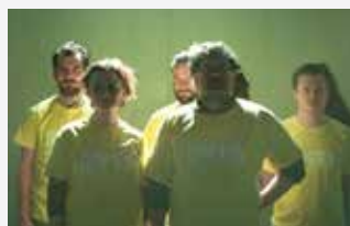
Drama Kopanec podhaluje okolnosti brutální vraždy teprve šestnáctiletého kluka ve východoněmeckém městě. Hraje se od 19:00 v budově Činoherního studia ve Varšavské ulici na Střekově.

Své odpovědi spolu se jménem a telefonním číslem zašlete na e-mail: redakce@zitusti.cz . Jména výherců budou zveřejněna na našem webu 20. února. Lístky budou k vyzvednutí před představením na pokladně.