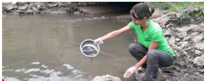
Odebírání vzorků vody a sedimentu z Labe.

ÚSTÍ NAD LABEM – Do labské vody se někde u Ústí uvolňuje velké množství jedovatých polychlorovaných bifenyly. Kde se přesně vzaly, se nyní snaží zjistit jak Česká inspekce životního prostředí, tak ekologové. Hygienici nedoporučují lidem se v řece koupat ani konzumovat odtud ryby.