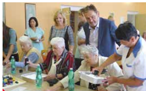
Senioři v DS Bukov navštívil i náměstek primátora Jiří Madar

Město také seniorům otevřelo prostory kulturního domu, kde se setkávají kluby. Také se zde 1. října bude konat vůbec první Den seniorů. ▶ pr