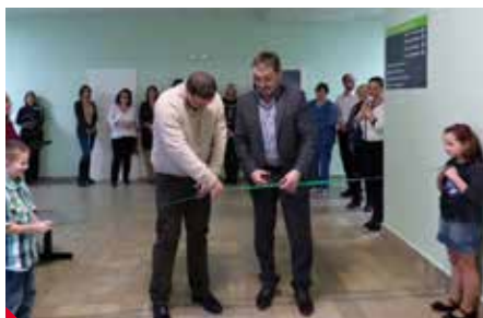
Slavnostní přestřižení pásky.