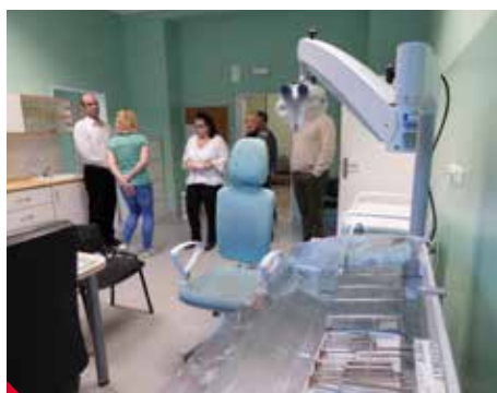
Jedna z nových ordinací.

Nové oddělení tvoří čtyři ordinace, které jsou vybavené novými přístroji. K tomu se rozšířil počet audiokabin z jedné na dvě. Audiokabina slouží k vyšetření poruch sluchu. Byly na ně dlouhé čekací doby, nyní se tedy objednávání pacientů výrazně urychlí. Jedna z kabin je navíc bezbariérová, mohou do ní snadno i vozíčkáři.