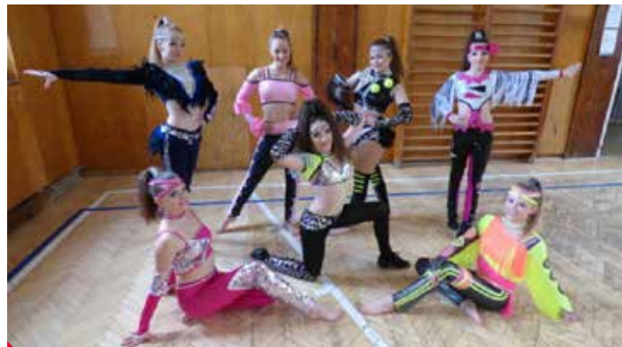
Taneční skupina Avalanche

ekologii, konkrétně ochranu ovzduší. Počítá se v něm se zapojením žáků vyšších ročníků a studentů střední škol. Naučí se měřit škodliviny ve vzduchu