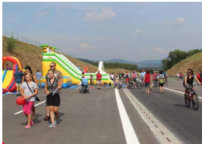
Stavbu dálnice D8 si v září přišly prohlédnout stovky lidí, mnozí na kole. Čekali tu na ně nejen průvodci, ale i zábava a atrakce pro děti.

Stavbu dálnice zkomplikoval sesuv, který část trasy před více než třemi lety zavalil. Jeho odstranění si vyžádalo čas. Podle expertů je na vině kame-nolom v Dobkovičkách, který se nachází nad dálnicí. Po něm chce ministerstvo dopravy miliardové odškodnění. ▶ lu