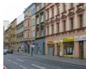
Nové poradenské centrum Raiffeisen stavební spořitelny najdete v Pařížské ulici.

kdykoli poradit s veškerými otázkami ohledně úvěrů na rekonstrukce i pořízení nového bydlení a samozřejmě i s dotazy na stavební spoření. K dispozici jsme vám od 8.30 do 16.30 hodin každý všední den nebo na telefonu 475 210 121 nebo 604 265 726. ▶