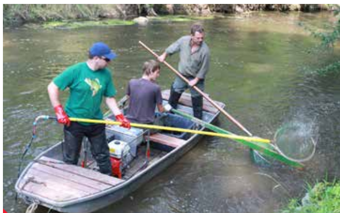
Rybáři do Bíliny vysadili několik druhů ryb, které se už rozmnožují.

Před čtyřmi lety zahájil Český rybářský svaz a společnost Unipetrol spolupráci, v rámci které do řeky vysadily několik set kilogramů ryb. Zpočátku šlo především o kapry a jelce jeseny, později se začali vysazovat také plotice, karsi, cejni, perlní nebo okouni. Kontrolní odlovy ukázaly, že vysazené ryby v řece nejen přežívají, ale dokonce se dál rozmnožují. „To znamená, že se čistota řeky zlepšila natolik, že se v ní život začíná obnovovat sám, bez pomoci člověka,“