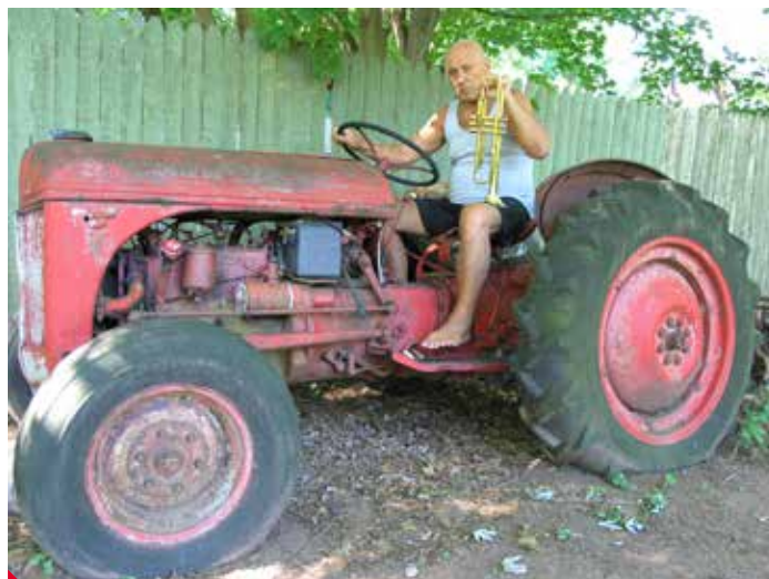
Začátky v Německu a pak v Americe nebyly jednoduché.

LD: Nebylo. Doba stála za prd, tak jsme ani neplakali.