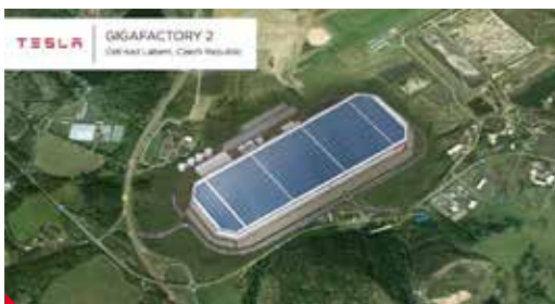
Vizualizace zveřejněná Martinem Hausenblasem

Podle mnohých ve prospěch Ústí nad Labem hraje několik faktorů. Leží ve středu Evropy a Česká republika patří k jedněm z největších výrobců automobilů na světě na přepočít obyvatel. Již stojí dálnice, která vede nejen do Prahy, ale město spojuje i s Berlínem, tedy klíčovým ně-