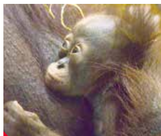
Poslední mládě orangutanů něšťastnou náhodou uhynulo.

Je vysoce pravděpodobné, že samice Nuninka opět brzy zabřežne a do roka se jí narodí další mládě. Oddělení chovného páru po porodu a separace samice s mládětem na další dobu je nemožná, neboť by se tím radikálně zhoršil komfort všech jedinců. Zoo získala v loňském roce finanční prostředky na obnovu projektové přípravy k pavilonu v horní části zoo, která započala již