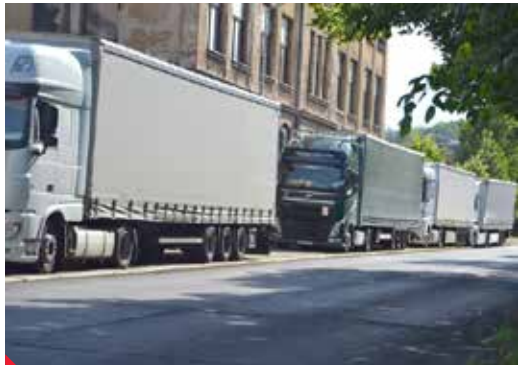
Kolony kamionů v Předlicích.

ÚSTÍ NAD LABEM – Silnice, ale i další místa v okolí sjezdů z dálnice využívají řidiči kamionů jako