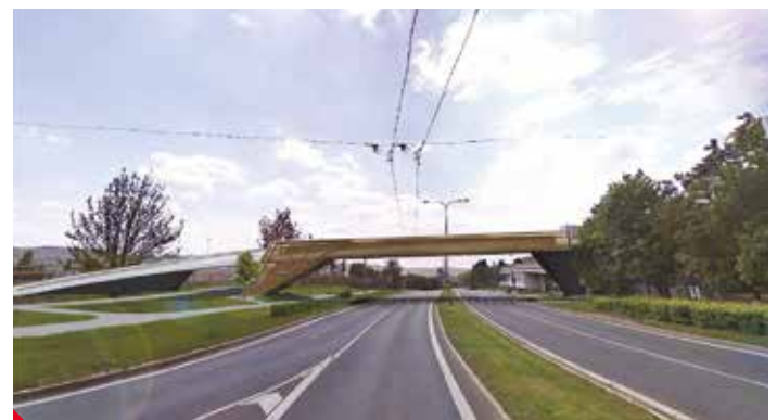
Studie připravovaného přemostění Krušnohorské ulice.

Chceme propojit jednotlivé části obvodu a hlavně jeho místa pro relaxaci a sport tak, aby bylo snazší pro obyvatele pohybovat se po celé Severní Terasě bez bariér. Máme studii na zajímavé řešení propojení centrálního parku s hřištěm u sektorového centra pro chodce, bruslaře i cyklisty přes Krušnohorskou ulici s frekventovanou silnicí přemostěním. Je to komfortní a bezpečné řešení i s ohledem na pohyb dětí. Předpokládaná cena je 40 milionů korun, ale při