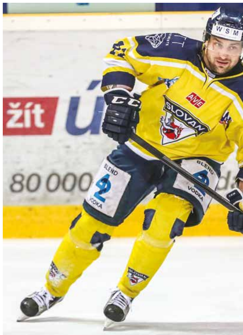
Rekordman ústeckého klubu má na svém kontě přes 400 startů v dresu Slovanu.

Obojí jde tak nějak ruku v ruce. I když si myslím, že ty zápasy jsou o něco těžší, protože člověk musí vydržet přes dvacet sezon být fyzicky fit a platný pro mužstvo. A když hrajete s hodně dobrými hráči, tak se ty body dají udělat hodně. Takže asi spíš ty zápasy.