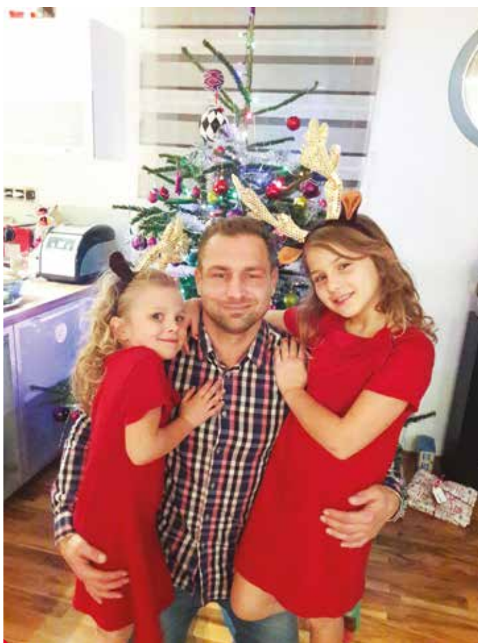
Hokejový útočník s dcerami.