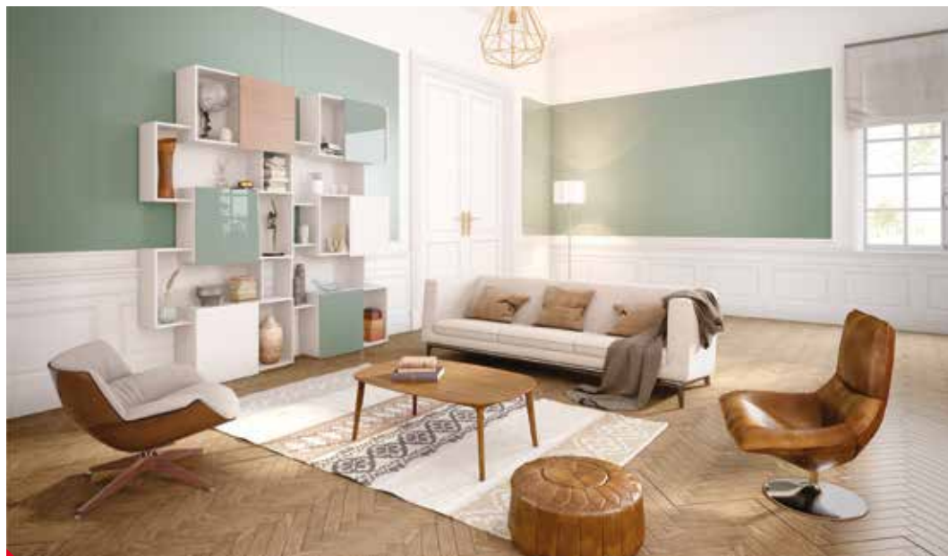
Sametově matný obklad stěn a lesklý obklad nábytku tón v tónu (Lacobel®/Matelac® Green Sage)

Možnost velkých ploch s minimem spár, snadná údržba, dokonale hladký povrch a nespočet dalších výhod přináší skleněné obklady. Ať již zvolíte aplikaci skla do jakéhokoliv prostoru ve vašem obydlí, dbejte na to, aby byla bezpečná. Sklo by mělo být vždy správně navrženo a nainstalováno.