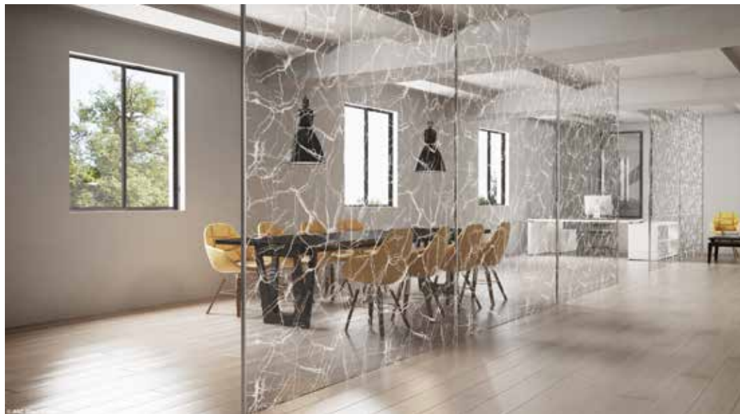
Rozdělení prostoru celoskleněnou stěnou, čiré sklo (Planibel Clearlite) s potiskem.

Vždy záleží na majiteli domu či bytu, zda zvolí do interiéru povrchově upravené sklo – např. mléčné (Matelux®) nebo s potiskem (Artlite), aby zachoval diskretnost prostoru za ním, nebo nechá vyniknout otevřenému prostoru a zvolí sklo čiré (Planibel® Clearlite), aby vytvořil nenápadné přechody. Trendem současného interiéru je použití vysoce reflexních skel (Stopsol) s efektem polopropustného zrcadla. Rozdílnou intenzitou světla před a za takovou skleněnou příčkou