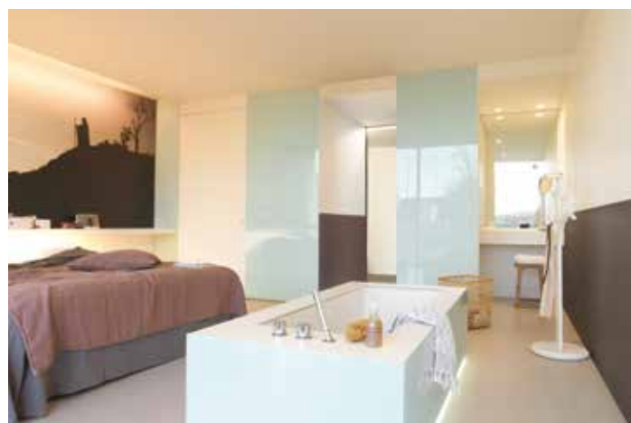
Posuvné skleněné příčky od podlahy až po strop zvýší místnost opticky, sklo Lacobel.