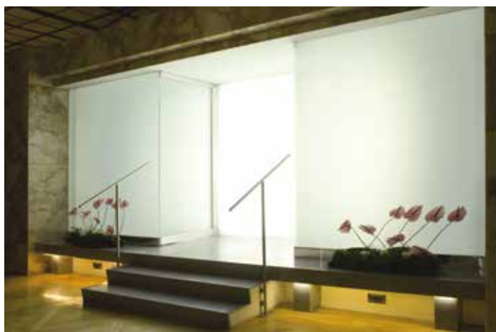
Průsvitným sklem (Matelux) zajistíte dostatečný přísun světla a nepřijdete o intimitu prostoru.