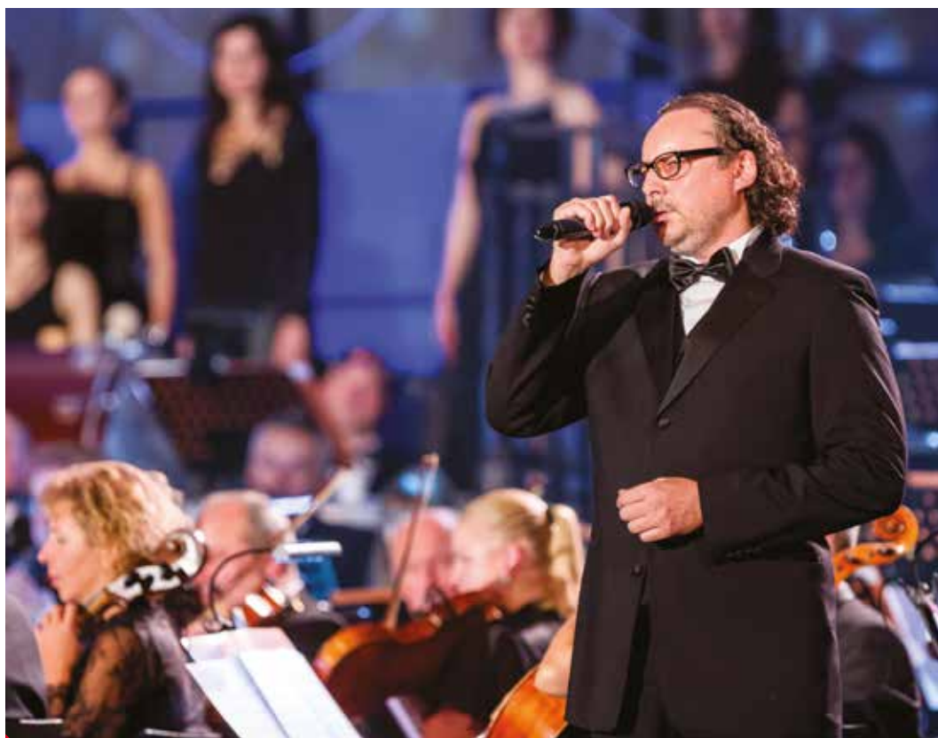
Z koncertu Prom Gala, k 25. výročí české premiéry muzikálu Bídníci.

Ano, úplně jinak ... v opeře a operetě vám nikdo nepomůže po zvukové stránce, jste tam sám za sebe. V muzikálu to trochu jde, když máte dobrého zvukaře, tak například