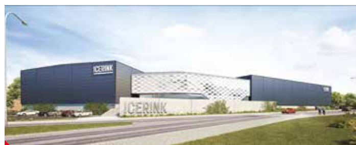
Takhle vypadá jeden ze stadionů projektu ŠKODA ICERINK v Praze – Strašnicích

„Jsem ráda, že se nám podařilo najít soukromého investora, který na vlastní náklady vybuduje nejmodernější halu s celoročním provozem hlavně pro veřejnost, pro naše děti, které neměly možnost si jít zabruslit kdykoliv. Prostor budou moci využívat naše školy, školky, adekvátní prostředí se nabídne také našim krasobruslařům, kteří doposud neměli ideální podmínky pro svůj sport. V našem městě vznikne moderní hala, kterou jsme velmi dlouho postrádali. Těším se, že vytvoří odpovídající podmínky pro to,