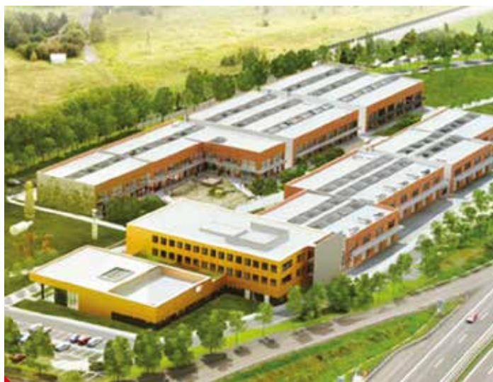
Vizualizace areálu z roku 2014 VIZUALIZACE: NP

Nupharo park také šetřil Evropský úřad pro boj proti podvodům (OLAF) kvůli podezření na dotační podvod.