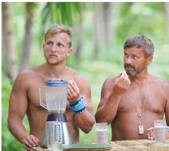
Pojídání červů Mirkovi nevadilo. Soutěž vyhrál

hudba: poslouchám skoro vše, po Robinsonovi asi Deep Purple