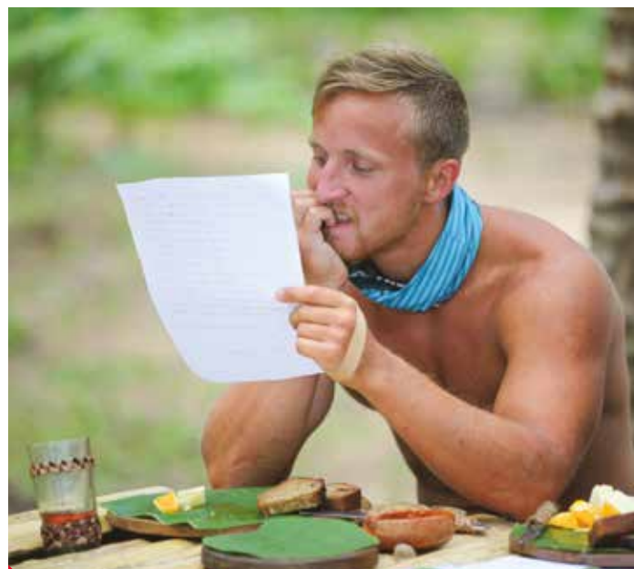
Při čtení dopisu z domova ukápla i slza