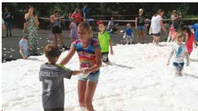
Podnikoví hasiči AGC potěšili děti nastříkáním pěny

Fotbalový turnaj AGC Cup patří mezi aktivity, které skupina AGC pro své zaměstnance pravidelně připravuje. Nejen díky nim firma dlouhodobě buduje v soutěži o nejlepšího českého zaměstnavatele. ► gz