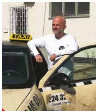
V samotném městě Ústí nad Labem se natáčela víc jak jedna třetina. Filmaři zde strávili

V seriálu se objeví známá parta vyšetřovatelů v čele s majorem Kunešem, náčelníkem Rohanem, Lupínkem, Máchou i Slepíčkovou. K nim postupně budou přibývat postavy další. První řada seriálu se odehrává na Karlovarsku a děj druhé řady se přesunul na Ústecko.