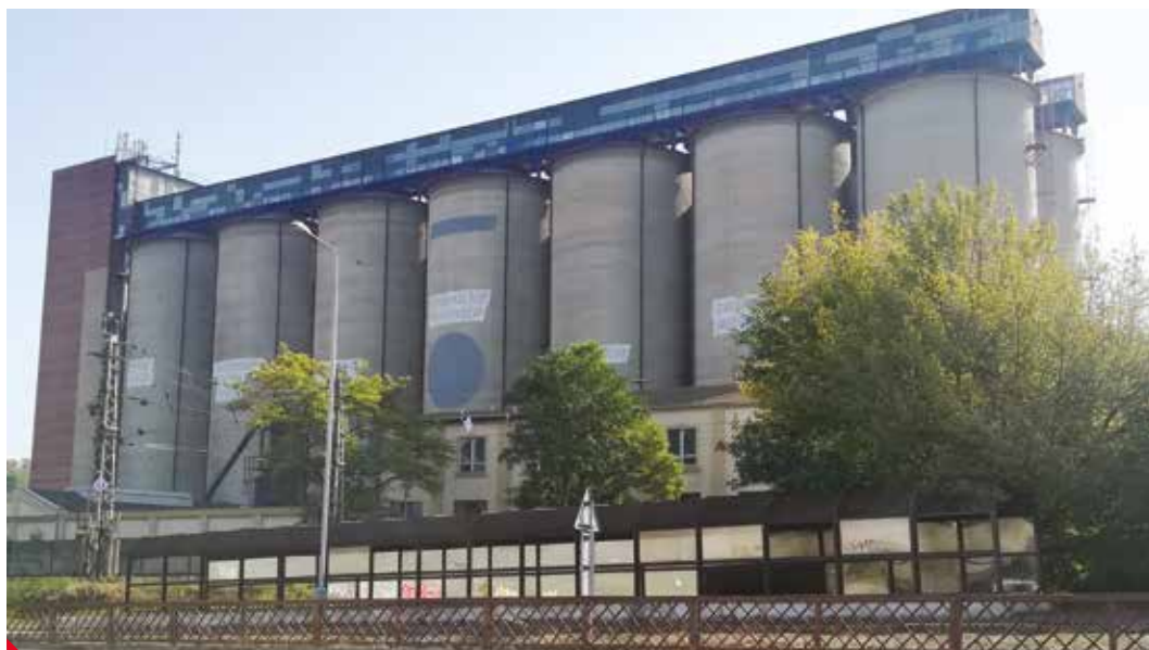
Zápach z areálu bývalé Setuzy obtěžuje nejen obyvatele Střekova

Nezaměnitelný zápach linoucí se z areálu bývalé Setuzy sužuje obyvatele Střekova, ale i jiných částech města. Nárůst stížností obyvatel na pach podobný oděru zkaženého masa eviduje ústecký magistrát, stížnosti obyvatel řeší také Česká inspekce životního prostředí.