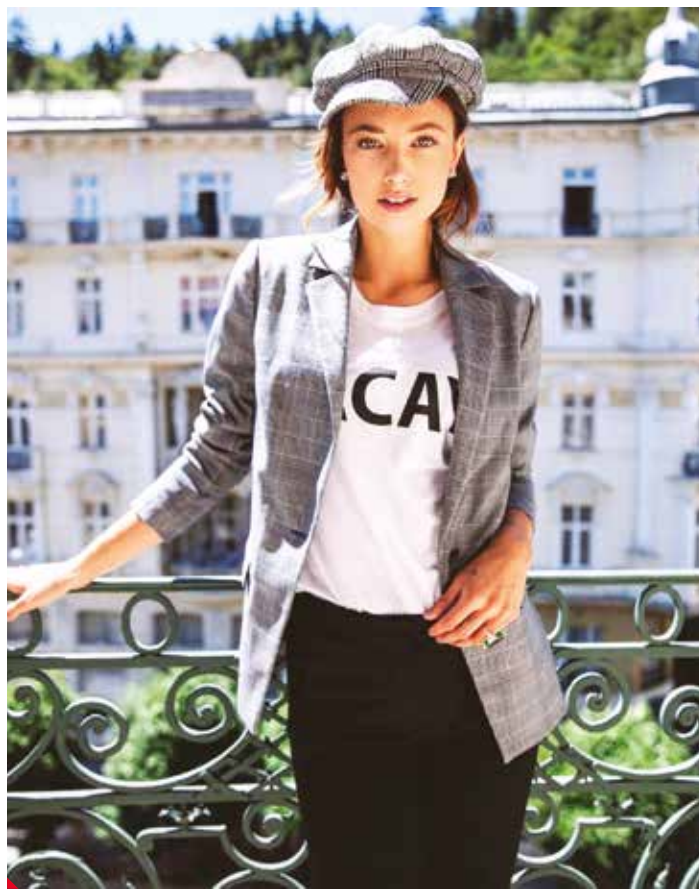
Lea Česko právě reprezentuje na Miss Universe

Všem čtenářům bych chtěla popřát veselé Vánoce