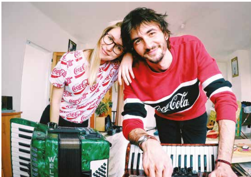
Se sestrou Eliškou nazpívali duet a společně vystupují.

neuvědomil několik důležitých věcí a nepotkal pár lidí, kteří mě nasměrovali a kteří mi pomohli v mojí, ale raději používám naši, cestě. Byla to vlastně ta písnička, která nastartovala všechno a jsem jí za to vděčný, ale nepatří mezi mé oblíbené, myslím, že máme už tak dvacet lepších (smích).