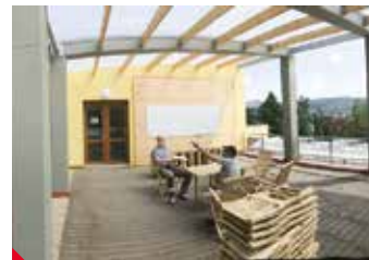
Na terase biologického centra mají studenti výhled na horu Milešovku.

Vedle toho stavba Centra biologických a environmentálních oborů v přírodní lokalitě