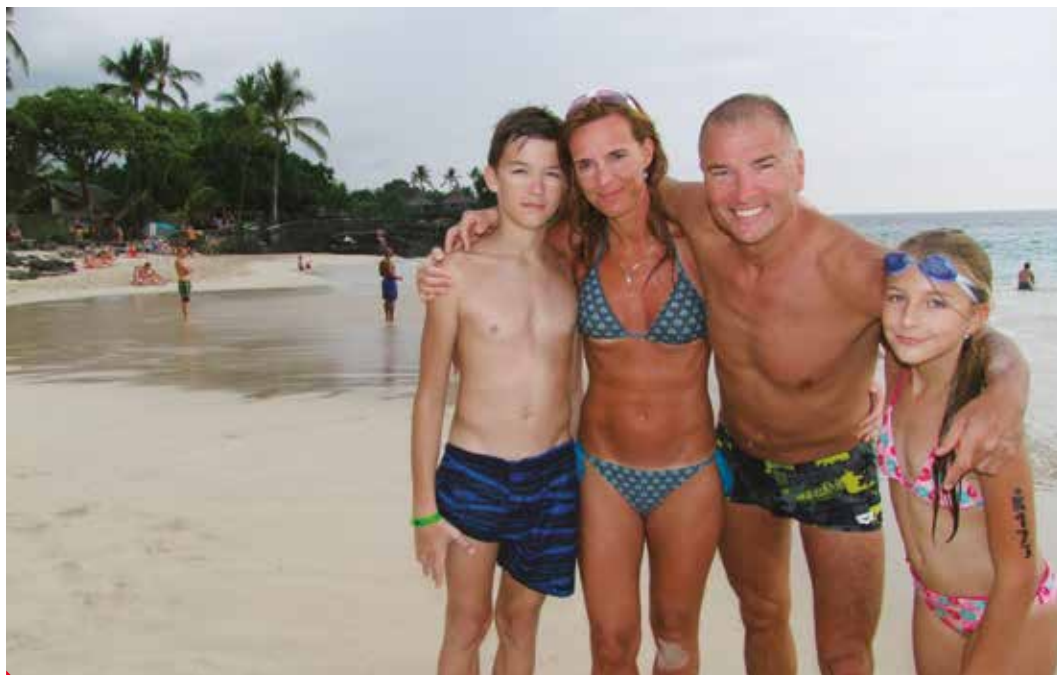
S manželkou Martinou vychovávají dvě děti.

Pražská rodina... jste ženatý a máte děti?