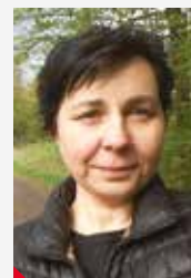
Ulice Na Nivách už není ulicí. Torza kdysi vystavních domů jsou pryč a město má novou volnou plochu. V osmdesátých

letech v ulici sloužila fungující hospoda nejnížší cenové skupiny, obchod s potravinami, školka. Kousek od hospody byla ubytovna Kubanců, pracujících v předlických podnicích, bydleli tu zaměstnanci drah, armaturky, chemopharmy, úředníci. Senioři, kteří zde tvořili starousedlickou komunitu, se krátce před listopadem 1989 přestěhovali do paneláku na Masarykově ulici, a Nivy začaly umírat. Noví nájemníci nepřicházeli a uvolněné prostory legálně i nelegálně na začátku devadesátých let obsadili tzv. neprizpůsobiví občané. Z ulice zaměstnanců se stala ulice nezaměstnaných a devastace novým životním stylem. Katastrofu podpořilo legislativní a privatizační šero v prvních letech po revoluci. Před městem je nyní rozhodování o využití území po demolici. Z Ústí zmizela část jeho historie. Pokud by zde měly vyrůst nové domy, je dobré vědět, že stejně rychle jak se staví, dokáží lidé bořit. Stačí málo. Nedůslednost, nevšímavost a falešná korektnost.