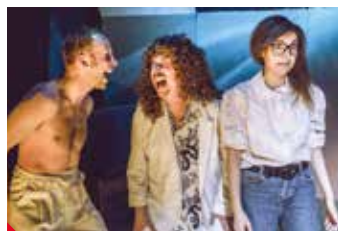
s odbarvovačem a mami, tati, Dylan pipe! Nechceš si o tom

Ústí nad Labem – V rámci divadelního festivalu Kult se v Hranicích představí i pražské Divadlo pod Palmovkou se skvělou hrou Pusťte Donnu k maturitě. Hraje se 15. října od 19.00. Čágo bélo, šilenci. Je právě tolik, kolik je a vaše oblíbené Studio PALM OFF přináší epizodu z vašeho dospívání. Brandon má nového walkmana, Kelly to přehnal