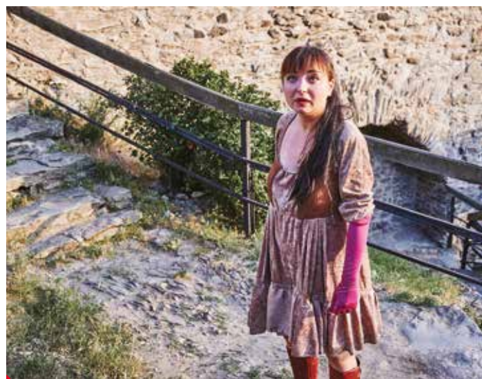
Sen noci svatojánské, ale trochu jinak než byste čekali.