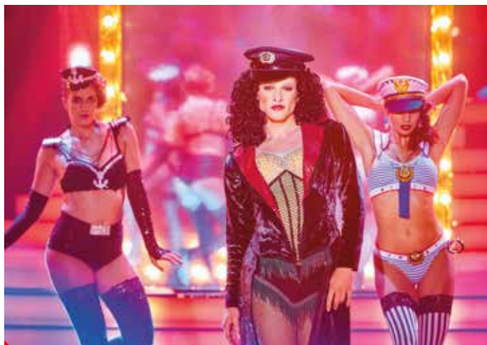
Markova Cher v show Tvoje tvář má známý hlas.