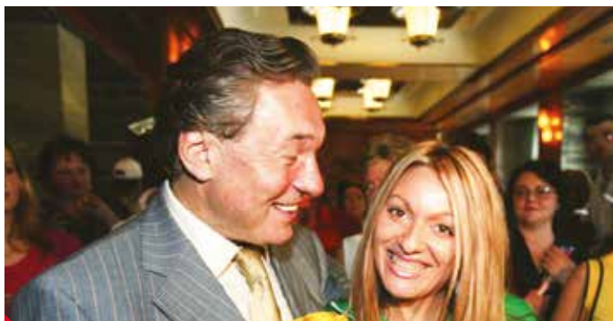
Na duet s legendárním Karlem Gottem je Martina pyšná.

nebo jsem měla možnost nazpívat pro televizi Nova úvodní píseň Mat dámou k seriálu On je žena. Ta se objevila i na mé debutové desce I Am Not From Here jako bonus.