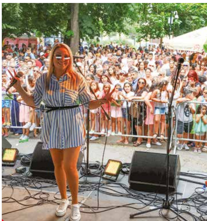
Ústeckou zpěvačku můžete vidět i na letních festivalech.

V první řadě bych ráda dokončila druhou desku. Také bych chtěla odstartovat podzimním koncertem v Ústí nad Labem šňůru po celé České republice. Ale hlavně plánuji být šťastná.