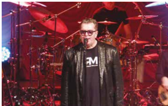
Richard Müller zazpíval oblíbené hity i nové skladby.