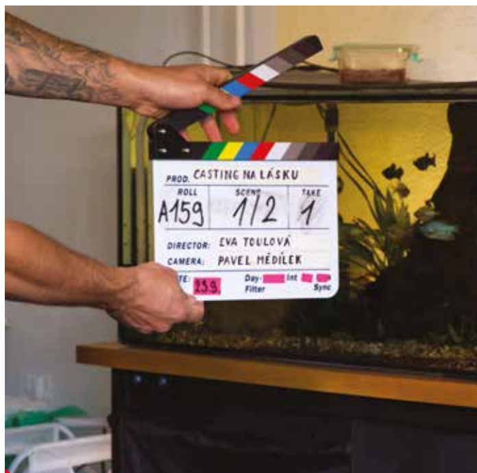
Film Casting na lásku se natáčí i v Ústí.

Poslední dobou se nesmírně zvedla úroveň zahraničních seriálů. Nikdy jsem neměla moc času je sledovat kvůli tomu, že jsem nestíhala. Teď, v období karantény to napravuji. Aktuálně u mě vede švédsko-dánský Broen/Most, Chernobyl, Broadchurch a Stranger Things.