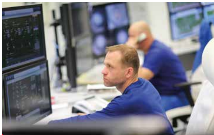
Veliny chemických provozů dnes už připomínají pracoviště jaderné elektrárny.

Máme kolem 830 zaměstnanců. Mají zajímavý a především stabilní příjem, mnoho benefitů a mohou se spolehnout na zájem velkého spolehlivého zaměstnavatele, což je nejen v současné době rozhodně důležité. Poslední čtyři roky zvyšujeme mzdy pravidelně dvakrát ročně. Výsledkem je kumulovaný růst průměrné mzdy například u dělnických pozic za toto období o cca 29 %. Tím se oklikou vracím k perspektivě chemie. Mnoho firem v dnešní době propouští, omezuje náklady a podobně. My ne - naopak stále hledáme