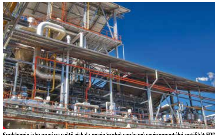
Spolchemie jako první na světě získala mezinárodně uznávaný environmentální certifikát EPD výroby epoxidových pryskyřic.