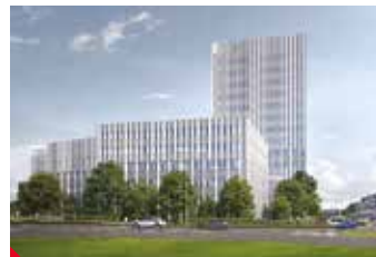
Vizualizace nového justičního areálu v Ústí nad Labem.

Připravuje se zadávací dokumentace na výběr zhotovitele stavby. Výběr zhotovitele je plánován ve 4. kvartálu roku 2021. Přípravné práce by mohly teoreticky započít ještě v tomto