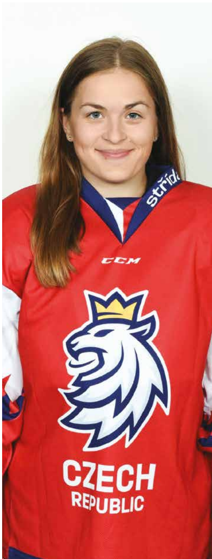
Obléct dres v národních barvách se líčkem na prsou je čest pro každého sportovce.

Začátky nebyly vůbec jednoduché, jsem rodinný typ, takže se mi dost stýskalo. Bylo to ale moje rozhodnutí se přestěhovat na druhý konec světa a plnit si sny. Já věděla, že i když rodina i kamarádi jsou tisíce kilometrů daleko, jsou tu pořád pro mě. Kanadani jsou velice přátelští a hodní, takže