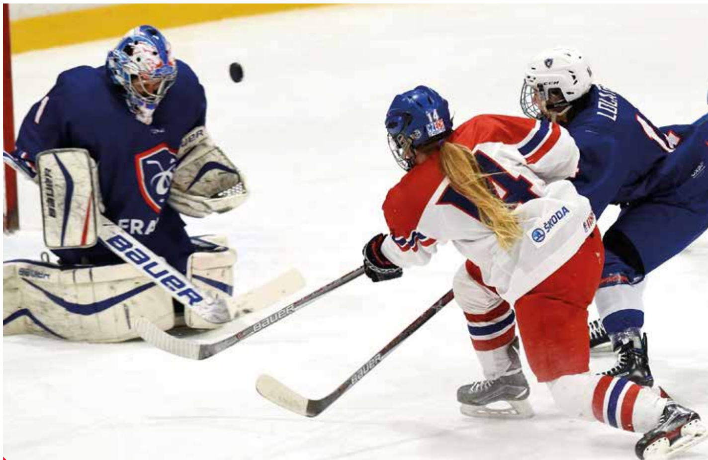
Ústecká rodačka reprezentovala Česko na Mistrovství světa IIHF žen v roce 2019 ve Finsku.

jsem si během pár dnů našla kamarády a bylo vše super.