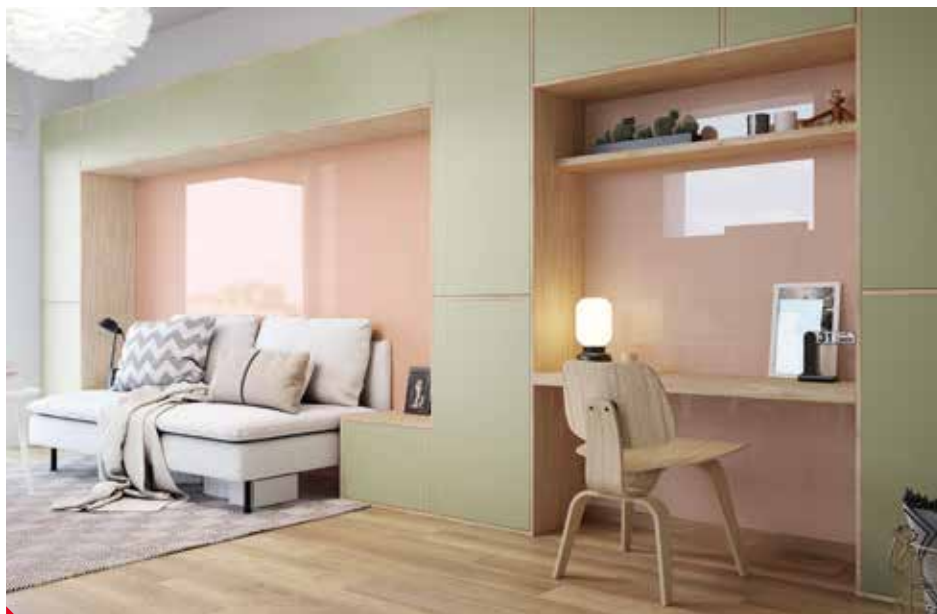
Příklad Přírodního stylu – Lacobel Pink Nude a Matelac Green Safari.

design interiérů a vy si sami můžete vybrat styl, ve kterém vám bude nejlépe. Nuže, inspiřte se!