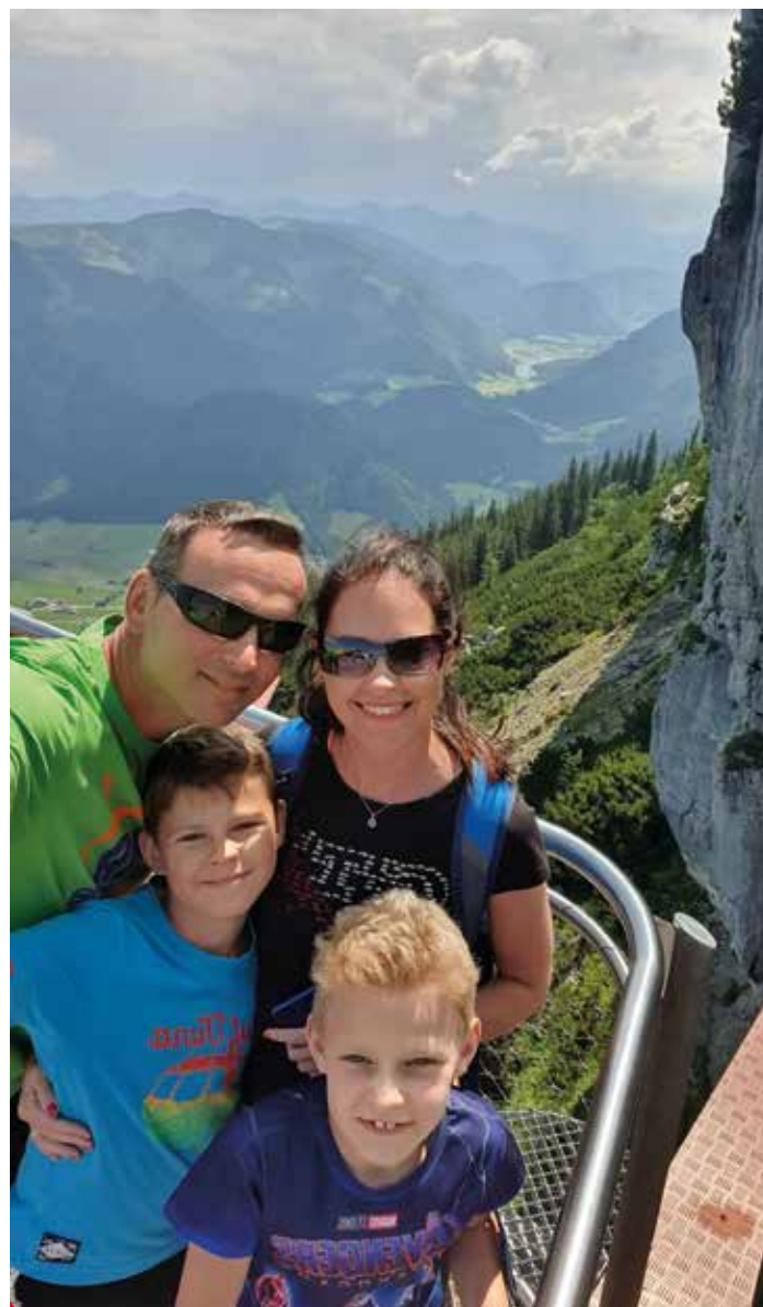
Volný čas ráda trávím s rodinou venku.

Všem bych popřála hodně zdraví, pohodu, klid, a pokud možno pořád úsměv na tváři, protože s úsměvem jde všechno líp.