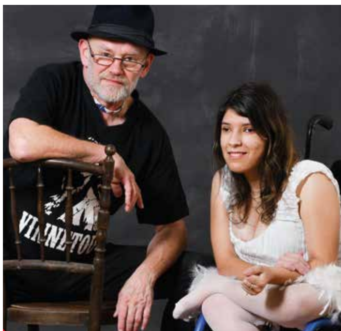
Setkání s fotografem Petrem Berounským bylo osudové.

u Nejdku, to je úžasný lom, kde trávíme spoustu chvil. V létě se chystáme do východních Čech na festival Tomáše Linky. Jezdíme do komunity lidí, kde mě prostě berou a dávají mi jistotu.