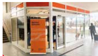
Kvůli rychlodráze vzniklo na nádraží infocentrum.

Podle hejtmána Jana Schillera zatím o konkrétní trase rozhodnuto není a výběr jednoduchý