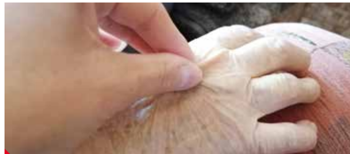
Když se kůže pomalu vrací do původní polohy, je člověk hydratovaný.

Určitě je důležité zaměřit se více na péči o pokožku. Objevují se opruzeniny, které nejvíce ohrožují obézní, diabetiky, imobilní, či klienty s inkontinencí. Prevence je jednoduchá - nosit prodyšné bavlněné oblečení, aby pokožka mohla dýchat, dbát na dostatečnou hygienu a v případě již mírného zarudnutí ošetřit místo zinkovou masťou, kterou lze volně koupit v lékárně. Podobně je to i v péči, kdy je již kůže poškozená a vznikl dekubitus - proleženina. Zde je nejdůležitější pravidelně polohování, zajistit čisté lůžko, větrat postižená místa, používat antidekubitní