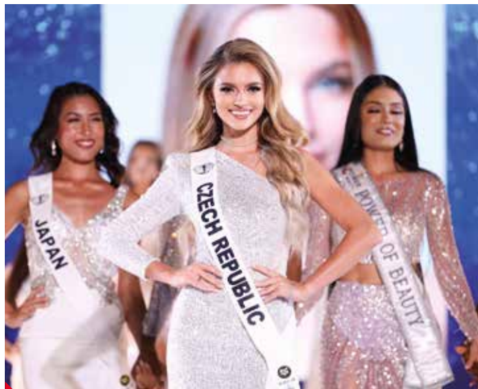
Rodačka z Chabařovic reprezentovala Česko i na světové soutěži.

Studuji vysokou školu, a to Univerzitu Karlovu obor Marketing a public relations. Momentálně pracuji jako modelka, influencerka a také spravuji sociální sítě a dělám administrativu pro jednu firmu. Ve volném čase se věnuji zdravému životnímu stylu, takže nejvíce času trávím v posilovně. Mou vášní je zvedat těžké váhy, což je pro dívku či modelku neobvyklou vášní. Ráda se neustále posouvám a vzdělávám, proto navštěvuji