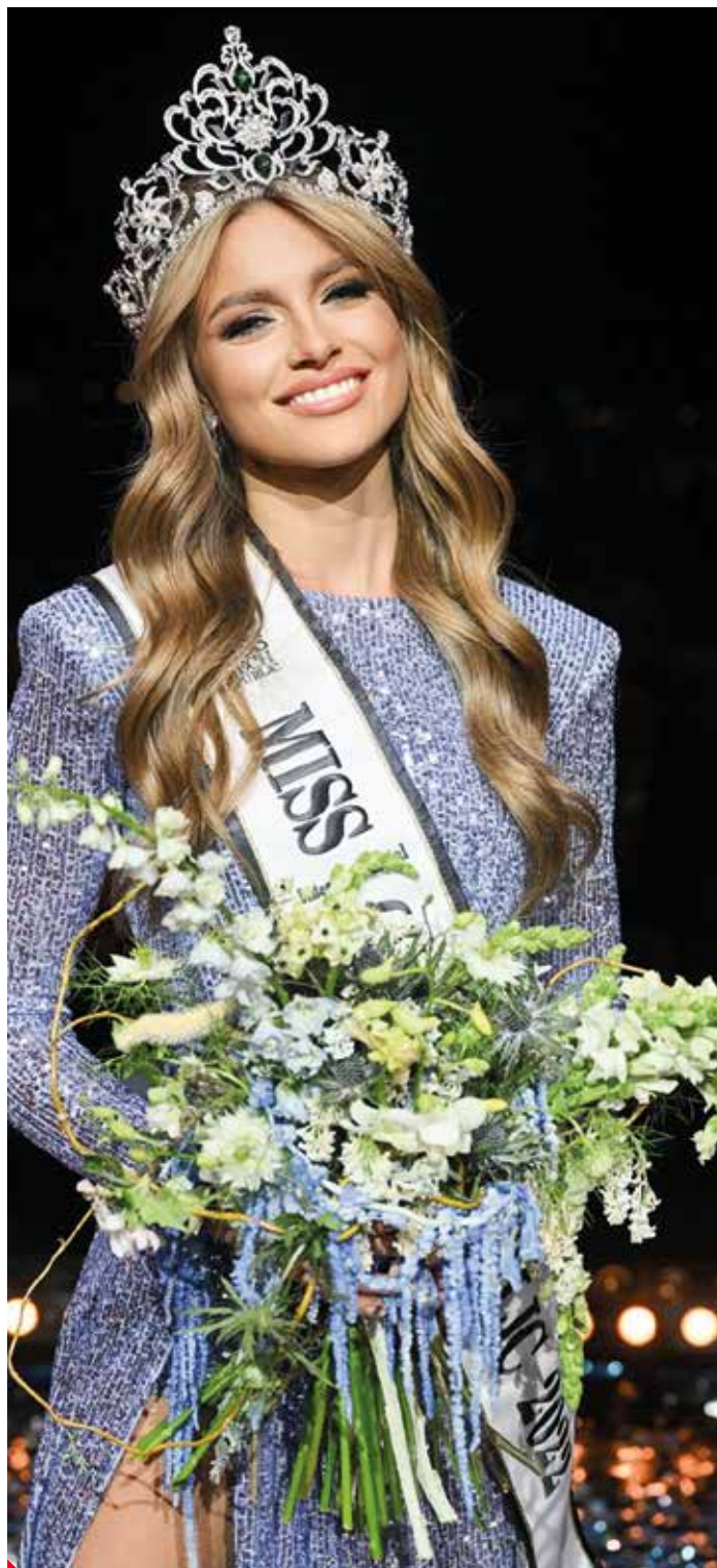
V soutěži Miss je důležité zůstat sama sebou.

Vzhledem k tomu, že jsem bojovala podruhé se dostat do finálové TOP 10, tak již ne. Poprvé, když jsem byla v Miss, probojovala jsem se pouze do TOP 20, to mě namotivovalo na sobě pracovat a přihlásit se znovu. Celý proces od