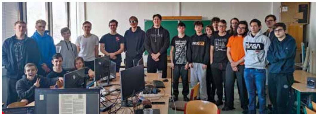
Týmy studentských vývojářů tvořily celých osmačtyřicet hodin ve stříbrnickém areálu ústecké průmyslovky.

Ústecká průmyslovka se dohodla se zřizovatelem, Ústeckým krajem, na vybudování centra kybernetické bezpečnosti. „Centrum vzniká průběžně. V letošním roce bude kompletně vybudována další nová učebna pro potřeby žáků IT oboru a ostatních oborů školy. Do budoucna je počítáno