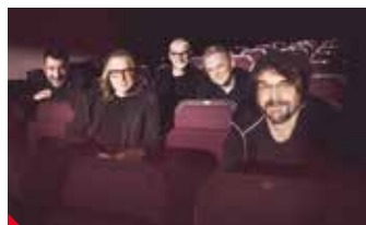
součástí kapely J.A.R. V roce 2000 překvapil fanoušky

Ústí nad Labem – Zajímavý koncert si můžete v dubnu užít v ústeckém kulturáku. Vystoupí na něm jedenáctinásobný držitel Ceny Anděl a Zpěvák čtvrtstoletí Dan Bárta, který se zapsal v devadesátých letech do širokého povědomí s kapelou Alice a účinkováním v muzikálu Jesus Christ Superstar. Stal se také neodmyslitelnou