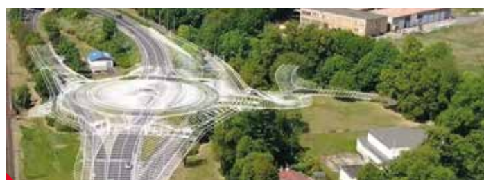
Okružní křižovatka Krásné Březno. Vizualizace: ŘSD

V Krásném Březně podle Ředitelství silnic dálnic (ŘSD) nová okružní křižovatka propojí všechny dopravní směry. „Takže dojde k eliminaci nebezpečných manévrů při otáčení vozidel a k celkovému usměrnění dopravy,“ říká mluvčí ŘSD Dana Zikešová a dodává, že nově bude zajištěno mimoúrovňové křížení s chodci a cyklisty. Zároveň bude podle Zikešové doplněn autobusový záliv. Nová okružní křižovatka pomůže i snížení rychlosti vozidel, která je podle provedeného kontrolního měření v místě významně překračována. Podle plánu má stát výstavba kruhového objezdu více