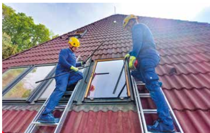
Výměna zasklení v rodinném domě v Přítkově.

Málokdo z laiků ví, že náklonem běžného izolačního skla se jeho tepelněizolační vlastnosti,