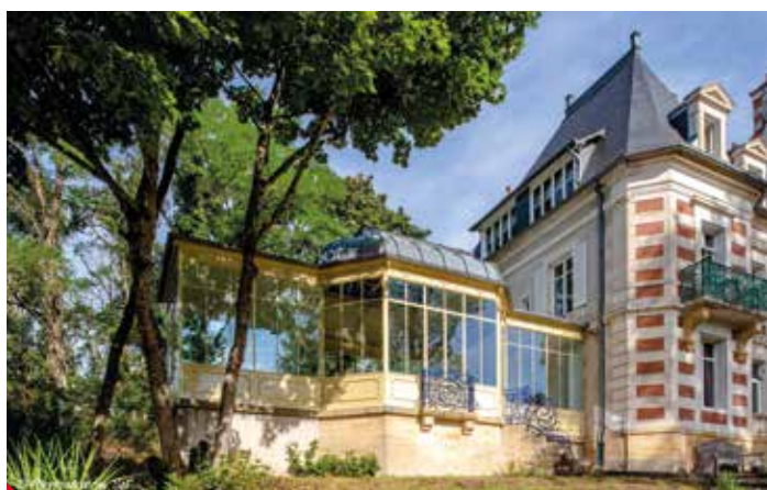
Fineo je vhodné i pro velmi oblíbené oranžerie a zimní zahrady.