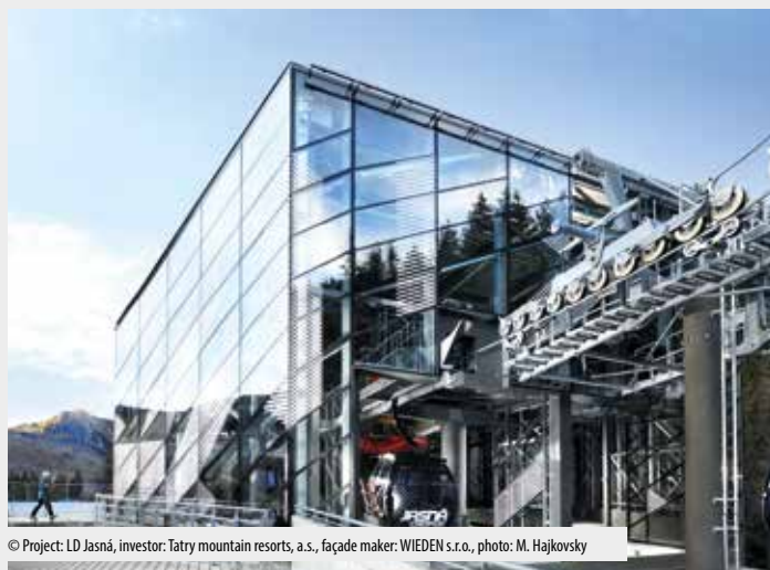
© Project: LD Jasná, investor: Tatry mountain resorts, a.s., façade maker: WIEDEN s.r.o.

Transparentní opláštění doplňuje grafický potisk skleněné fasády a večerní nasvětlení objektu.