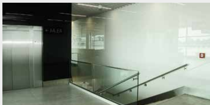
Skleněné obklady stěn na Letišti Václava Havla

krčky. Sklo jako snadno udržitelný a odolný materiál našlo své uplatnění na obkladech zdí i přepážek, v transparentní podobě jako zábradlí či izolační zasklení. Jelikož se jedná o veřejné prostory, je i v tomto případě nutné zvýšit odolnost prostřednictvím dalšího zpracování základního skla, a to procesem laminace, tepelným zpracováním nebo obojím, dále použitím bezpečnostní fólie. Od roku 2006 je cestujícím k dispozici Terminál 2, který zajišťuje lety v rámci shengenského prostoru. V roce 2018 uvedlo letiště v rámci Terminálu 1 do provozu nový,