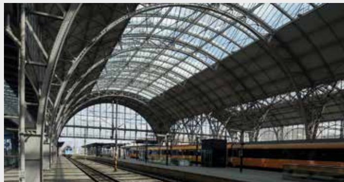
Ocel a sklo chrání nástupiště Hlavního nádraží v Praze

Další stavbou, kde se lze setkat se skly AGC, je ojedinělý nadzemní tubus mezi stanicemi Rajská zahrada a Černý Most (již z roku 1998) či stanice Hradčanská, jejíž vstupy mají azurové zabarvení. Od roku 2015, kdy na lince A přibýly nové stanice, dominuje prosklená klenutá střecha stanici Nemocnice Motol. Vrstvené bezpečnostní sklo s mléčnou fólií bylo použito pro výtahovou šachtu