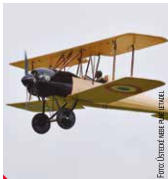
FOTO: ÚSTECKÉ NEBE PLNÉ LETADEL