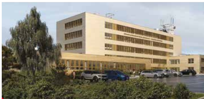
Projektový model. Tak by měla vypadat budova Výstupní 2 po rekonstrukci.

Ano. Museli jsme v krátkém čase přestěhovat potřebné vybavení pracoviště Výstupní 2 do opuštěné budovy po gymnáziu Stavbařů 5 na Severní Terasě. Ještě předtím bylo třeba nově instalovat sítě a zlikvidovat vyřazený majetek a já musím poděkovat některým žákům a učitelům, že se do budování provizoria zapojili a na spoustě instalačních prací se podíleli. I to je důkaz, že naši žáci jsou dobře připraveni pro praxi. ▶ pr