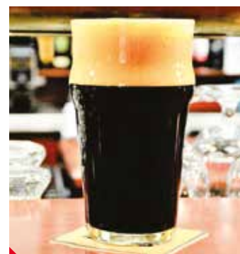
Tajemný Porter.

S příchodem lezavé zimy rychtářská kuchyně rozšířila jídelní lístek o vydatnější dobrotu, třeba o vynikající hovězí guláš, kachnu nebo pečený bůček. Každý adventní víkend si můžete také pochutnat na specialitách, které v menu obvykle nenajdete. „Třetí adventní víkend se naši hosté mohou těšit na typický vánoční pokrm, kterým je voňavý houbový kuba s česnekem