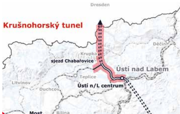
Mapa plánované trasy vysokorychlostní železnice. MAPA: SPRÁVA ŽELEZNIC

Odborníci podle projektu plánují 16 vrtů. Ty budou hluboké minimálně 25 metrů, nejhlubší bude měřit 485 metrů. Data z průzkumu pomohou při rozhodování