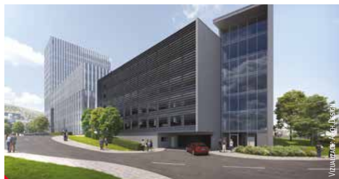
VIZUALIZACE: A+CH DESIGN