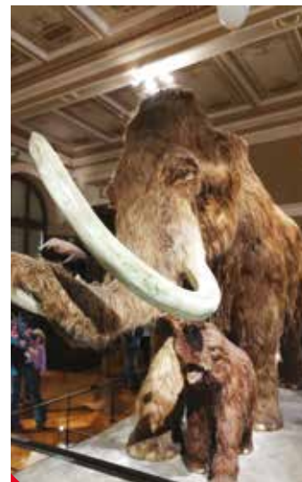
Model mamuta s mládětem je k vidění v Národním muzeu.