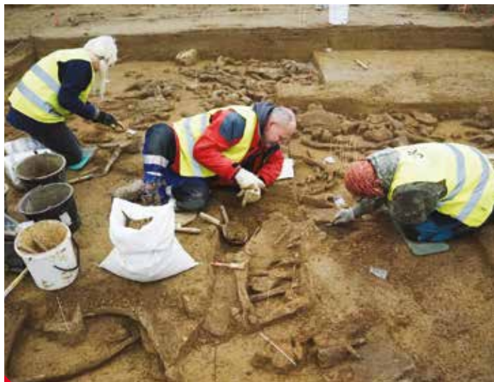
Archeologové odkrývají mamutí pozůstatky, které mění pohled na pravěk v Česku.

Naleziště pochází z období pozdního gravettien, tedy mladého paleolitu, který se časově kryje s poslední dobou ledovou. Kromě mamutích